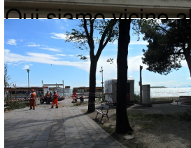
Qui siamo sul molo pontile.