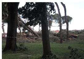
Questi sono i tetti delle case.