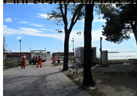
Qui siamo sul molo pontile. In alto: i tetti delle case. In basso: il molo pontile, con i tetti delle case in alto.